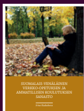
Finnish-Russian Glossary of E-Learning and Vocational Education Terms

Glossary of Food Safety Terms was compiled in the project Finnish Food Safety Expertise (Elintarviketurvallisuus vientituotteeksi), co-financed by the European Regional Development Fund.