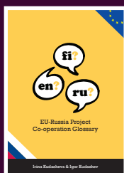
EU-Russia Project Co-operation Glossary (English-Finnish-Russian)